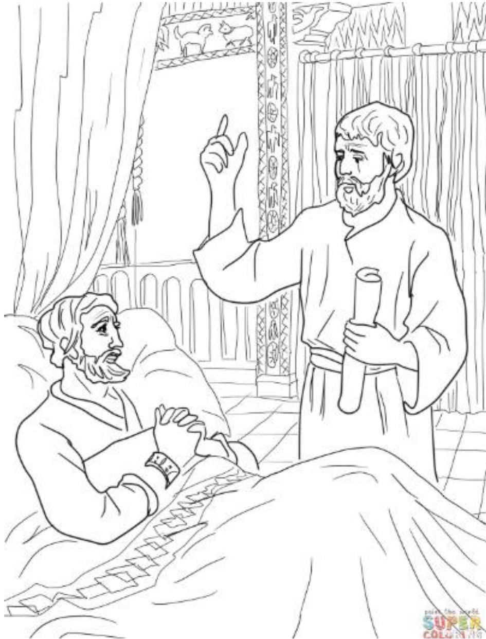
Koning Hizkia en Jesaja